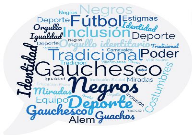
Gráfico I: Recurrencias en las narrativas de informantes claves

Fue, precisamente, “el decir” de la comunidad villanovense quien abrió paso al entendimiento del sentido de pertenencia que representa “Ser de Villa Nueva”; permitiendo percibir el carácter trascendental y valioso que se otorga a lo tradicional; y reconociendo el lugar indudable que ocupan el deporte y la recreación en su cotidianidad. También se ha evidenciado cómo el deporte desde sus inicios en la comunidad constituyó identidades y las fue afianzando a lo largo del tiempo, sin importar la edad ni el barrio de procedencia