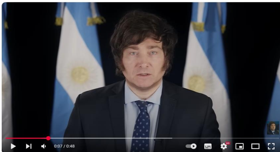
Figura 2. Milei entre banderas argentinas

En este sentido, se puede decir que los spots son positivos por carácter mítico (Johnson-Cartee y Copeland, 1997 citado en García Beaudoux y D'Adamo, 2006: 89) alrededor de la figura de Milei: los tres spots comienzan con él hablando, bien iluminado y con las banderas argentinas de fondo, en el spot B, además de las banderas, se ve en su escritorio una pequeña escultura de un león como así muchísimas imágenes en la que se lo muestra con multitudes de gente que lo sigue (pidiéndole autógrafos, abrazándolo), entre otras cosas.