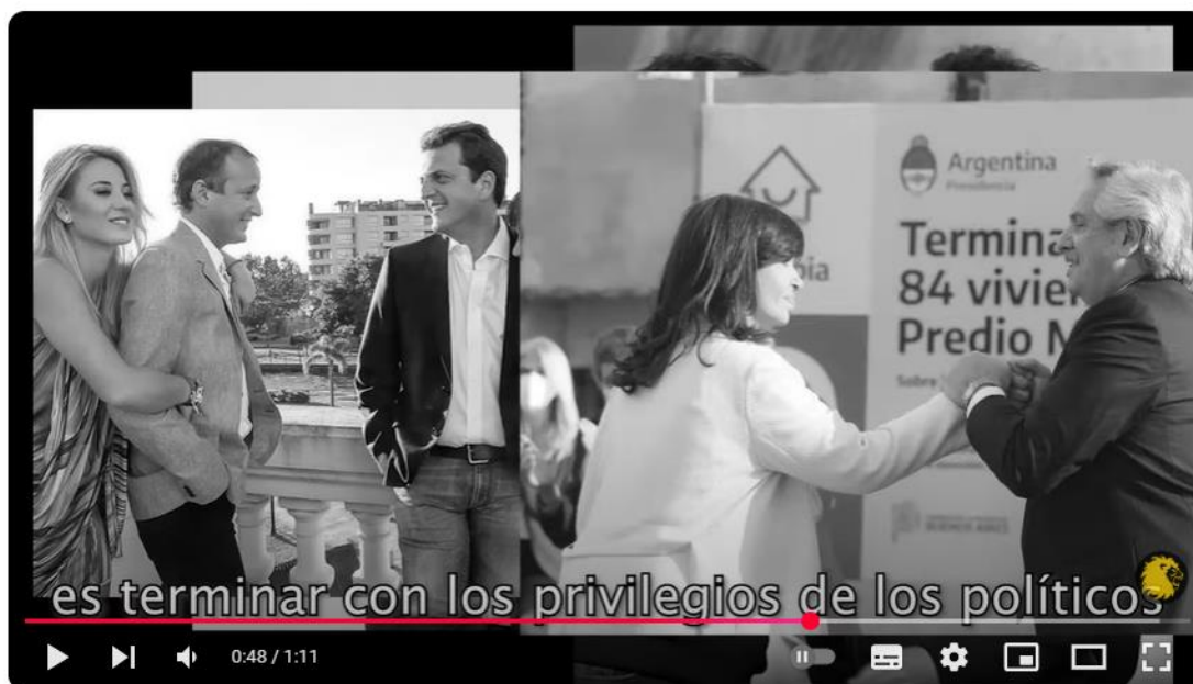
LA ESPERANZA VENCE AL MIEDO / SPOT FINAL DE MILEI

Nota. Captura de pantalla del video spot C, previo al balotaje.