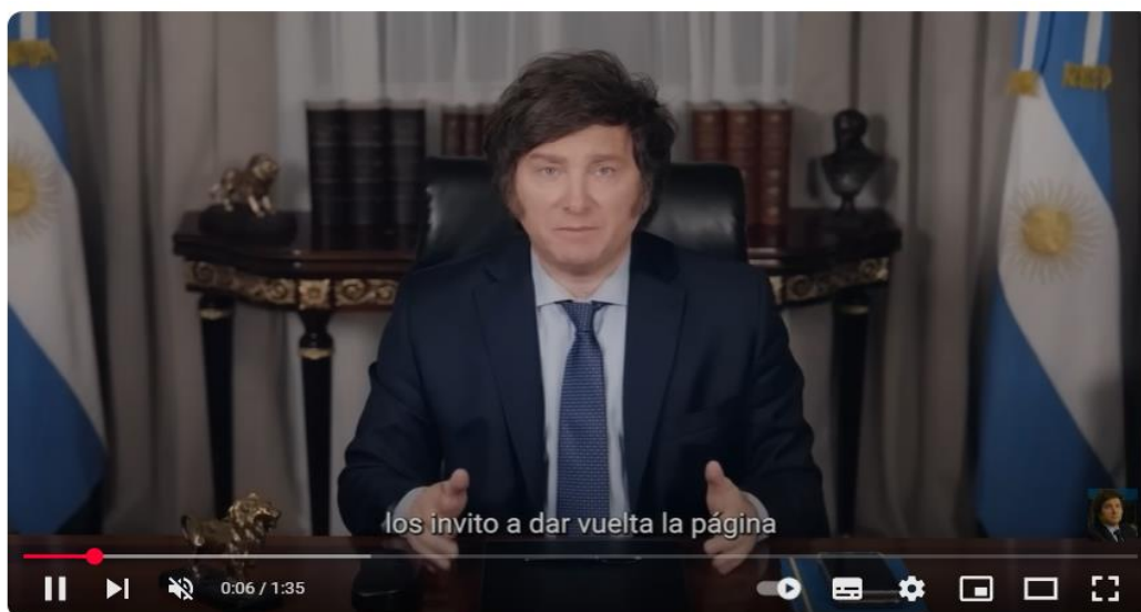
Figura 3. Milei entre banderas argentinas y acompañado de escultura de león

Spot Final de Javier Milei: el comienzo de una nueva Argentina- 18/10/23