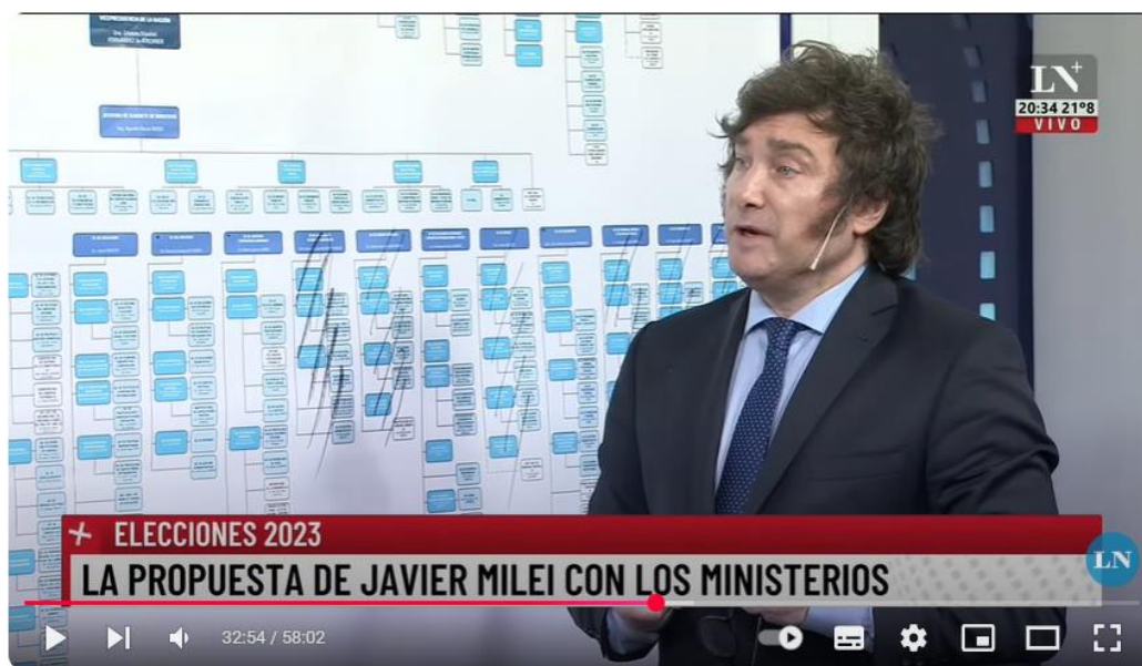
La entrevista completa de Javier Milei con Jonatan Viale

Nota. Captura de pantalla del video “aparición A”, en la entrevista a Javier Milei con Jonathan Viale. Fuente: La Nación, 2023a, Youtube ( https://youtu.be/_or7WsE9CpU?si=7QLX5Y6ukvsXdzRt )